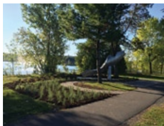
Oeuvre Marée du sculpteur Jules Lasalle et se nomme Marée réalisée en août 2015